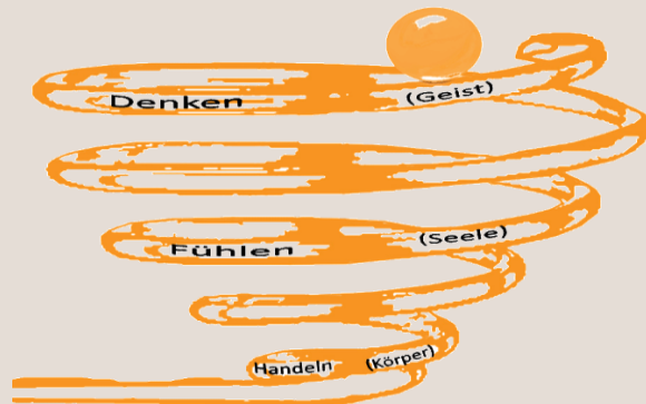
Lernmodell nach Ursula Hampe

Ganzheitlichkeit bedeutet Denken, Fühlen und Handeln in einen Zusammenhang zu bringen. Veränderungen im Denken führen zur Gestaltung neuer Wege und Ansätze in scheinbar schwierigen Situationen. Das führt zur Erweiterung der Wahrnehmungs- und Handlungskompetenzen. Zufriedenheit und Sinnfindung werden möglich und sind gesundheitsfördernd.